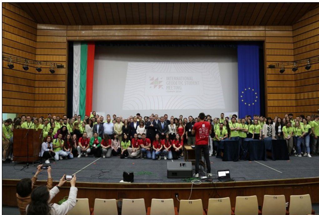
Slika 1. Učesnici IGSM-a (zelene majice) i organizatori (crvene majice) na uvodnoj ceremoniji

Ovogodišnji IGSM je organizovan u Bugarskoj, preciznije u njenom glavnom gradu Sofiji, u periodu od 13.05. – 17.05.2024. godine. Učešće je uzelo 157 sudionika iz zemalja širom svijeta. Univerzitet u Sarajevu je predstavljalo 5 studenata Građevinskog fakulteta, koji su za učešće na izložbi pripremili plakat s temom „Geodetsko naslijeđe Bosne i Hercegovine“, a na kojem su predstavljeni instrumenti i dokumenti koji su izloženi na Odsjeku za geodeziju i geoinformatiku