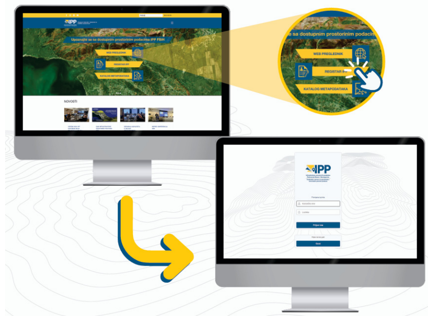
Slika 2. Registri IPP FBiH

Također, kada je u pitanju Katalog metapodataka, izradene su procedure replikacije sa Kataloga metapodataka Kantona Sarajevo (koji je uspostavljen 2022. godine) na centralni Katalog metapodataka IPP FBiH.