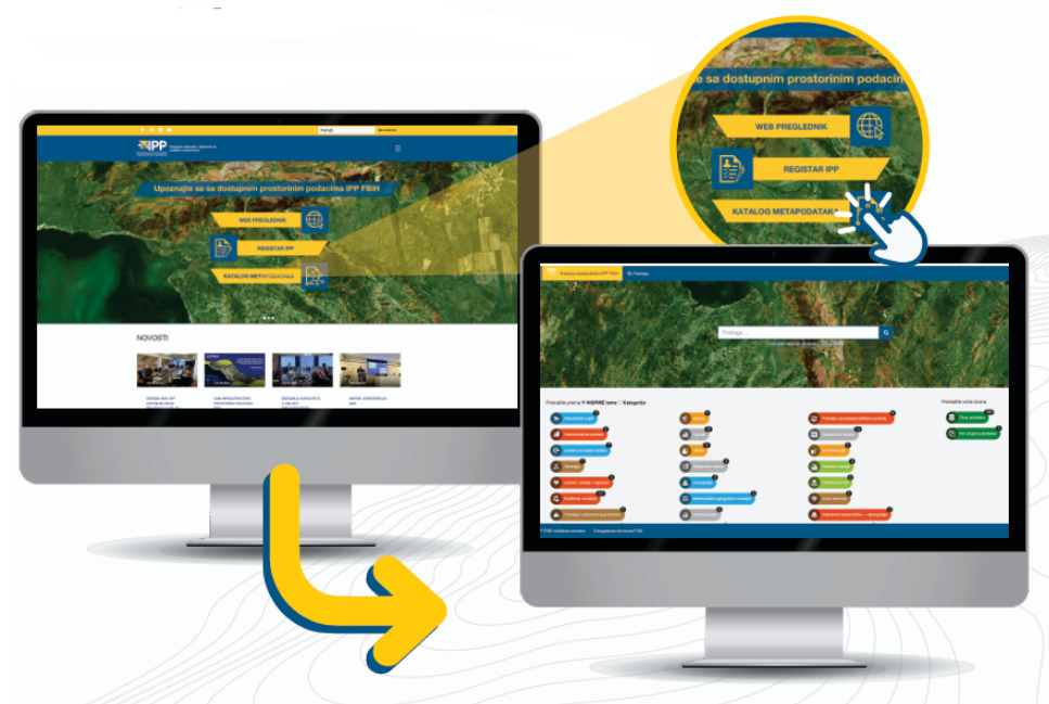
Slika 3. Katalog metapodataka IPP FBiH