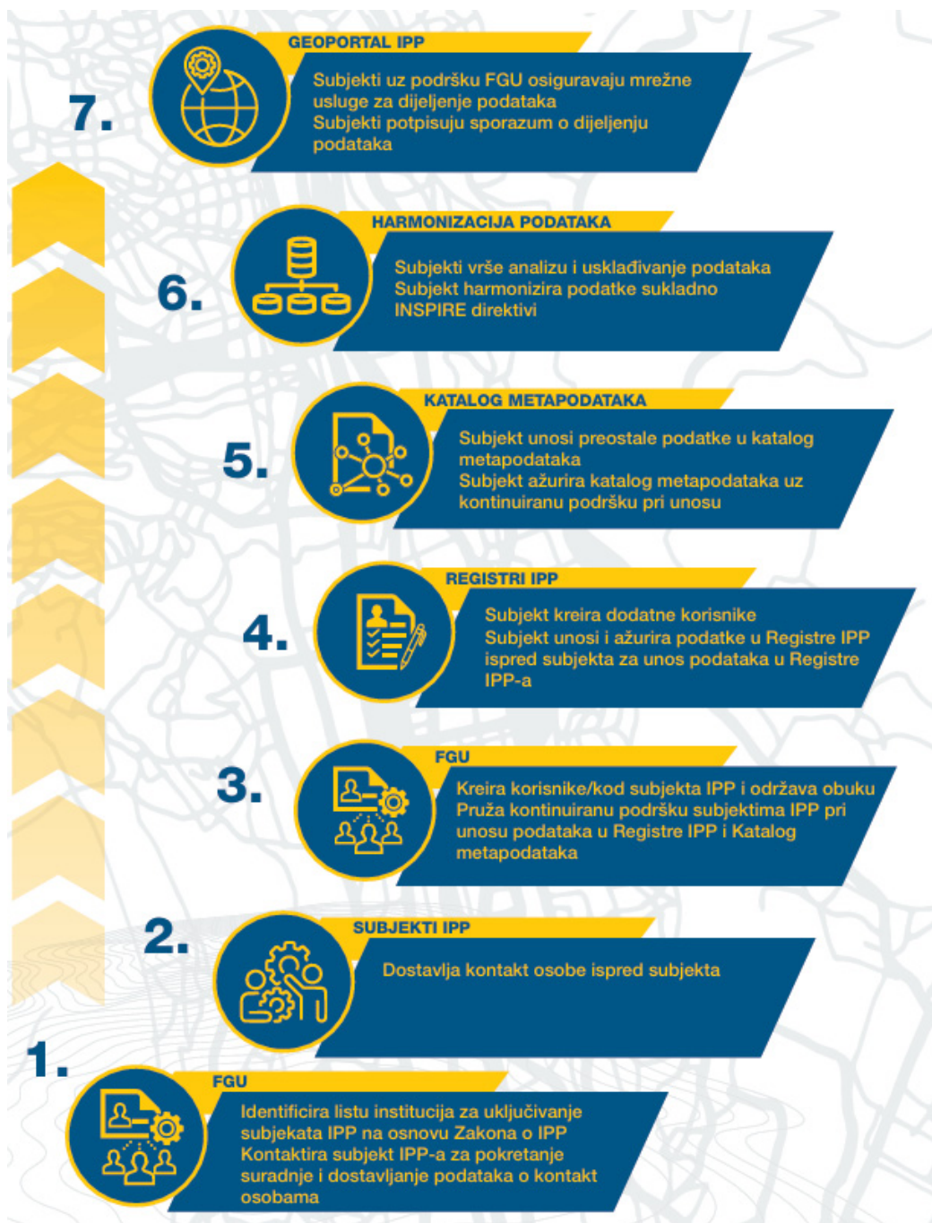
Slika 1. Organizacijski model IPP FBiH

Preglednik IPP i Katalog metapodataka su značajno unaprijeđeni sa aspekta funkcionalnosti, dizajna i drugih bitnih značajki, te je trenutno dostupno više od 325 zapisa metapodataka, te su prikazani podaci koji pripadaju 30 INSPIRE tema, uneseni od strane 20 subjekata IPP FBiH.