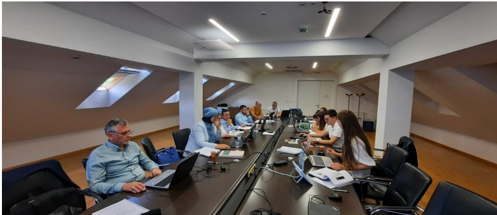
Slika 8. Izgradnja kapaciteta subjekata IPP FBiH

Osnovni cilj je sticanje kompetencija iz oblasti upravljanja prostornim podacima, njihove pripreme, prikaza i dijeljenja, kao i sticanje osnovnih znanja kada je u pitanju infrastruktura prostornih podataka. Na navedenim obukama učestvovali su predstavnici preko 25 institucija/javnih preduzeća sa državnog, federalnog i kantonalnog nivoa, a koji su prepoznati kao subjekti IPP FBiH.