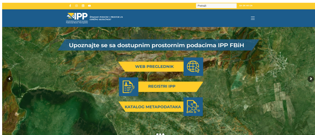
Slika 6. Novi dizajn web stranice IPP FBiH

Novi logotip i slogan koji glasi – “Spajamo podatke i prostor za održivu budućnost” – jasno odražavaju misiju povezivanja prostornih podataka s ciljem podržavanja održive budućnosti za sve građane Federacije Bosne i Hercegovine.