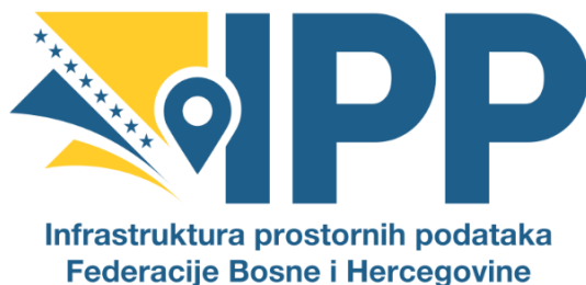
Slika 7. Novi logotip IPP FBiH

Novi logotip i slogan koji glasi – “Spajamo podatke i prostor za održivu budućnost” – jasno odražavaju misiju povezivanja prostornih podataka s ciljem podržavanja održive budućnosti za sve građane Federacije Bosne i Hercegovine.