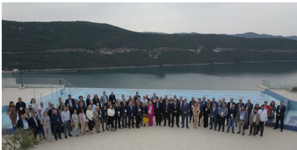
Slika 9. Zajednička fotografija sa posljednje konferencije „Dani IPP FBiH“ održane 17. i 18.10.2024. godine u Neumu

Kada je u pitanju konferencija „Dani infrastrukture prostornih podataka Federacije BiH“, ukupno je održano 5 konferencija u prethodnih 10 godina (od kada su počele inicijalne aktivnosti iz predmetne oblasti), od čega su u prethodne tri godine održane tri konferencije, a organizator je bila Federalna uprava za geodetske i imovinsko-pravne poslove. Ova, sada već tradicionalna, konferencija predstavlja jedinstvenu priliku za okupljanje svih subjekata u području infrastrukture prostornih podataka u Federaciji BiH, kao i drugih zainteresiranih strana,