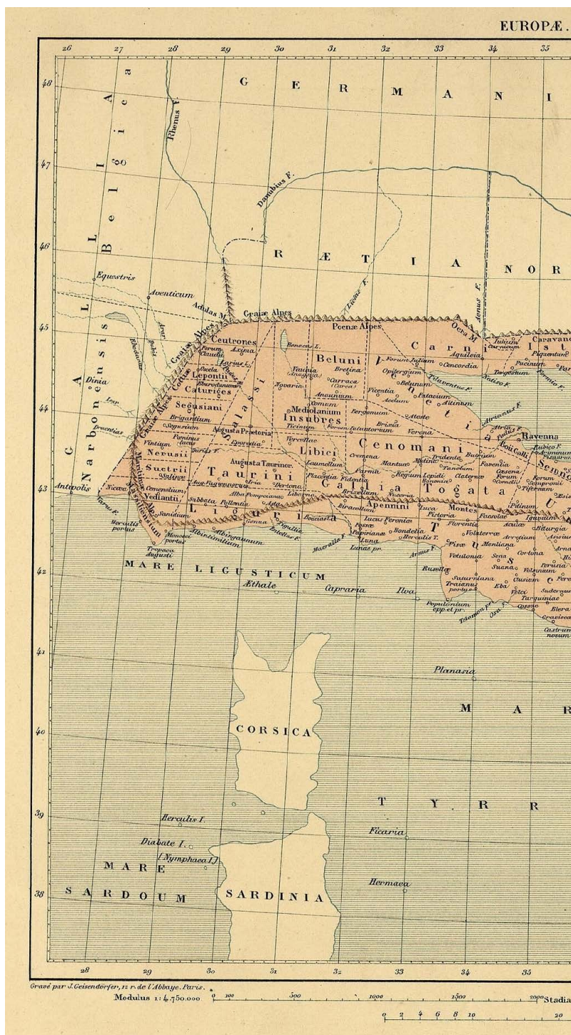
Slika 2. Ptolemejska VI. karta Europe, redakcija C. Müllera iz 1901.