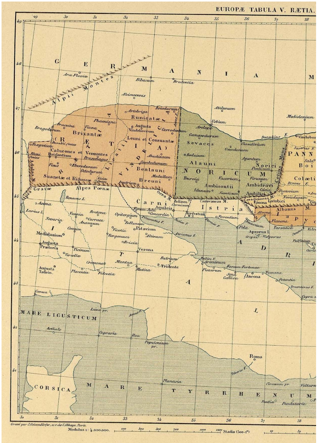
Slika 1. Ptolemejska V. karta Europe, redakcija C. Müllera iz 1901.