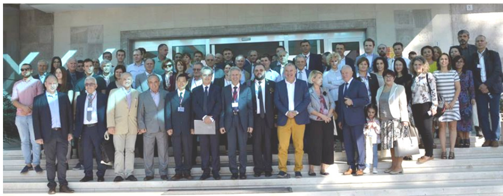
Slika 2. Učesnici Konferencije ispred hotela Interkontinental u Tirani.

nagrada je “Western Balkan Scientific Excellence”, potom, nagrada za najbolji prezentirani rad na Konferenciji, nagrada za mlade istraživače i nagrada za studentske radove.