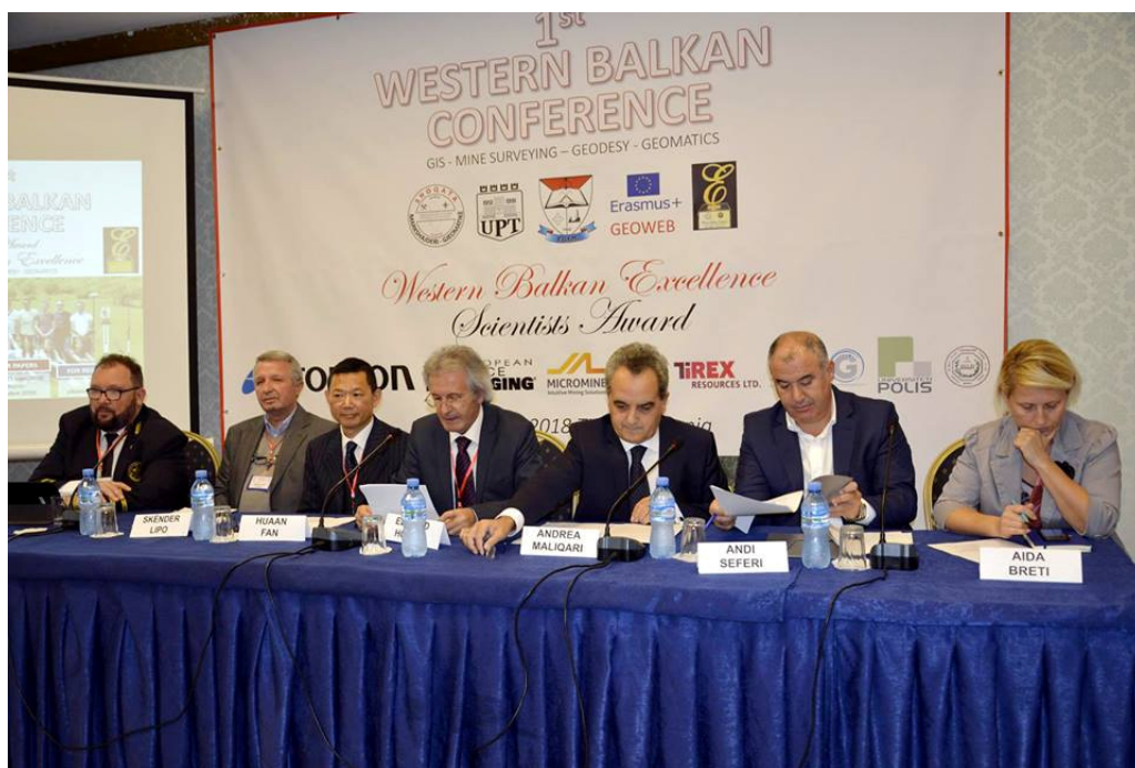
Slika 1. Otvaranje 1. Konferencije za Zapadni Balkan: GIS, rudarska mjerenja, geomatika i geodezija.

Univerzitet u Tirani organizirao je Konferenciju na temu GIS, rudarska mjerenja, geomatika i geodezija na Zapadnom Balkanu, 3. i 4. oktobra 2018. Prvi dan konferencije posvećen je završnim aktivnostima GEOWEB Erasmus + projekta iz oblasti izgradnje kapaciteta u visokom obrazovanju pod nazivim: Modernizacija geodetskog obrazovanja na Zapadnom Balkanu s fokusom na kompetencije i ishode učenja. Univerzitet u Sarajevu bio je partner u GEOWEB projektu, a projektne aktivnosti su provodene na Odsjeku za geodeziju i geoinformatiku Građevinskog fakulteta. Planirane aktivnosti projekta su uspješno provedene. Modernizirani kurikulum studija za bachelor i master program geodezije i geoinformatike, razvijen je kao važna aktivnost projekta. Studenti koji su u oktobru 2018. godine započeli studije geodezije i geoinformatike na bachelor i master programa primjenju ovaj modernizirani program. Na slici 1. pokazano je otvaranje Konferencije, dok su na slici 2. učesnici Konferencije.