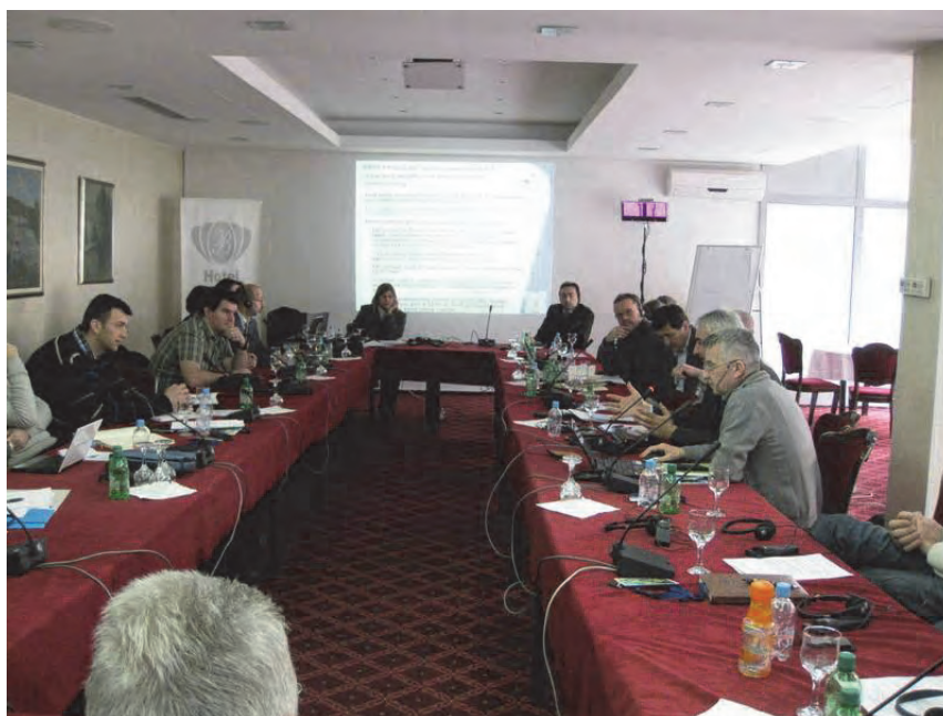
Slika 1: Sudionici radionice

http://www.fao.org/europe/meetings-and-events-2013/lc-bih/en/ .